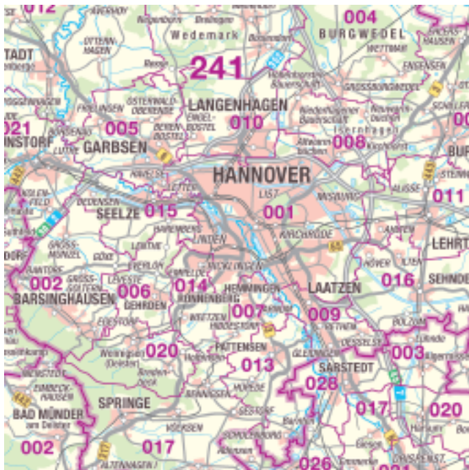
Ausschnitt ÜKN500 Verwaltungsausgabe

Die Vektordatei der DÜKN500 ist in Farbe mit Adobe Illustrator als Summen- oder Einzellayer erstellt worden.