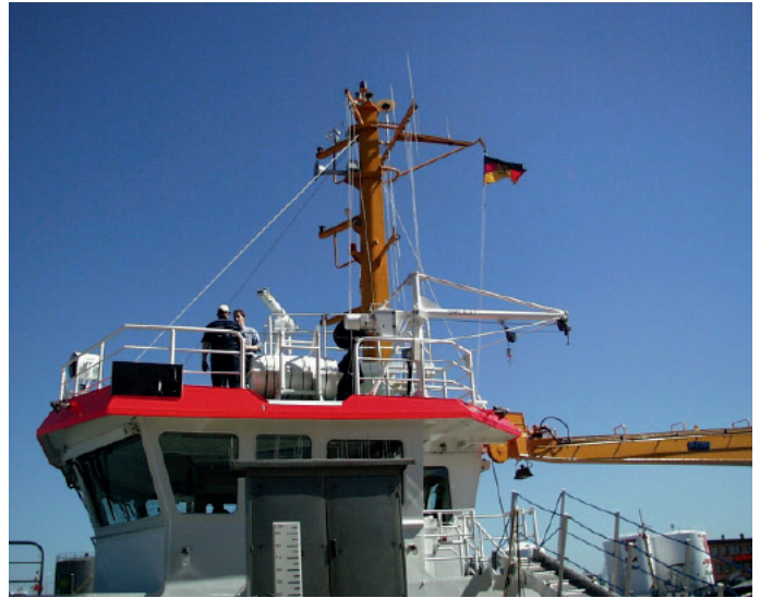
Vermessungsschiff mit SAPOS®-HEPS